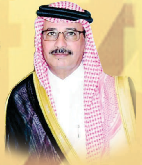
اللواء م يحيى سرور الزايد