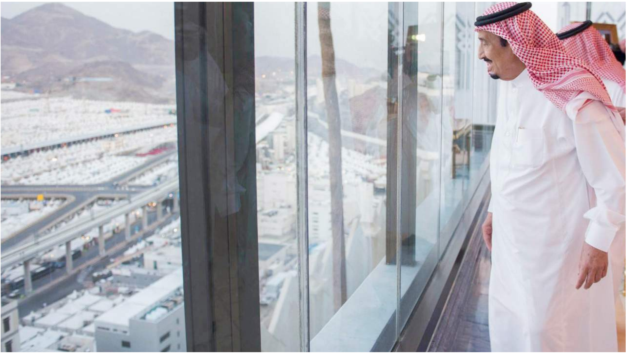
خادم الحرمين الشريفين يحيط ضيوف الرحمن بعنايته الدائمة.