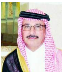
اللواء يحيى الزايدي

على نهج ومسيرة ورؤية واحدة، هدفهم الحفاظ على الدين الإسلامي وخدمته وتسخير كافة الإمكانيات لكل المسلمين داخل الوطن الغالي وخارجه، وكذلك تذليل العقبات لكل قاصدي بيت الله الحرام من أصقاع المعمورة، ناهيك عن الاهتمام الكبير بما يحتاجه المواطن والمقيم في كافة أرجاء هذه البلاد الغالية دون تقصير، في ظل دعم واهتمام ورعاية خادم الحرمين