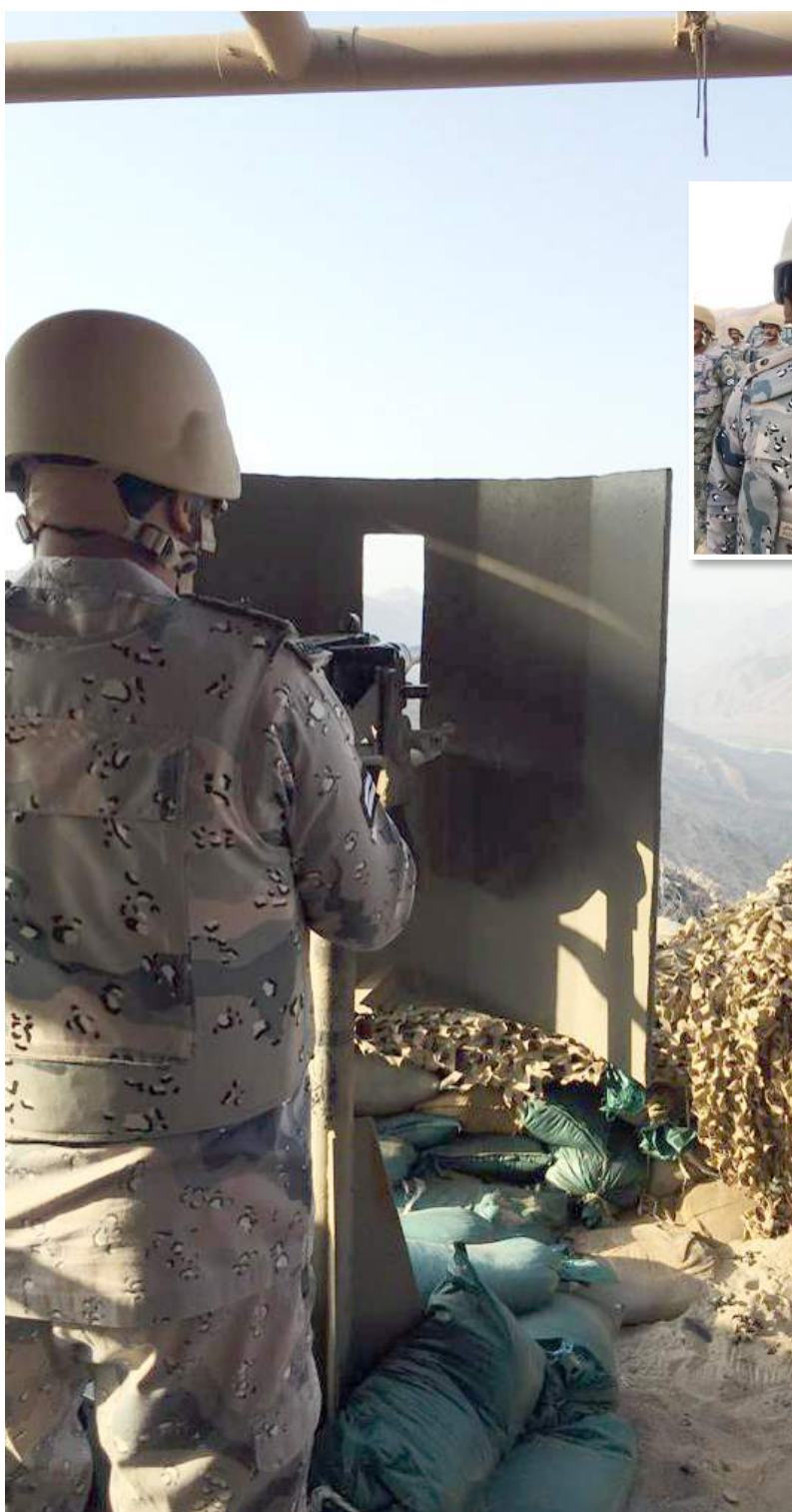
يقظة ومراقبة مستمرة.