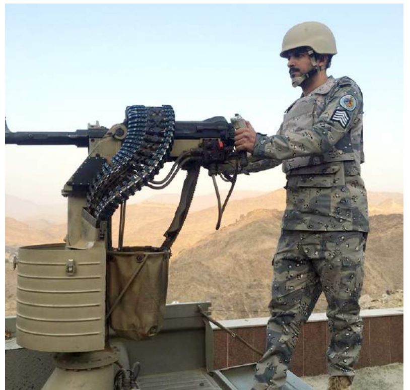
تأهب واستعداد على خطوط النار.