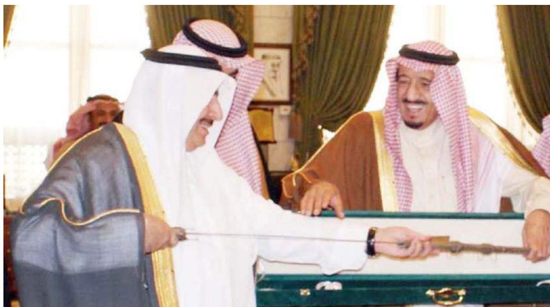
.. ومتسلماً سيف جمعية المؤسس.