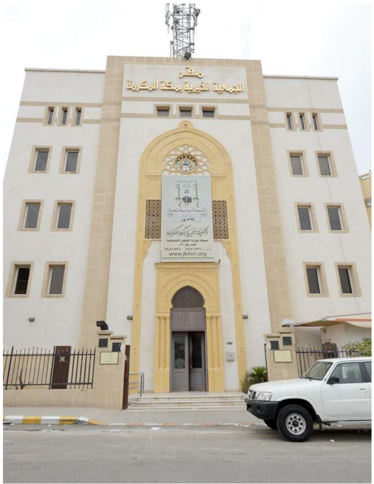
مبنى الجمعية الخيرية بمكة المكرمة.

وقدمت الجمعية العديد من الخدمات الخيرية بمكة المكرمة خلال السنوات الماضية لأكثر من مليون مستفيد، ولديها مركز غسيل بنحو ٦٠ غسلة كلوية مجانية يومياً لفقراء الحرم. ناهيك عن مركز طبي