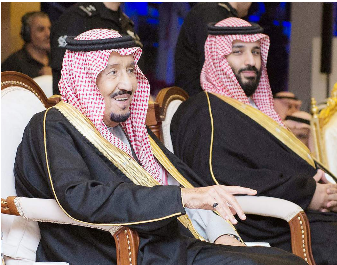
المملكة شهدت قفزات تنموية وحضارية في عهد خادم الحرمين الشريفين وولي عهده.