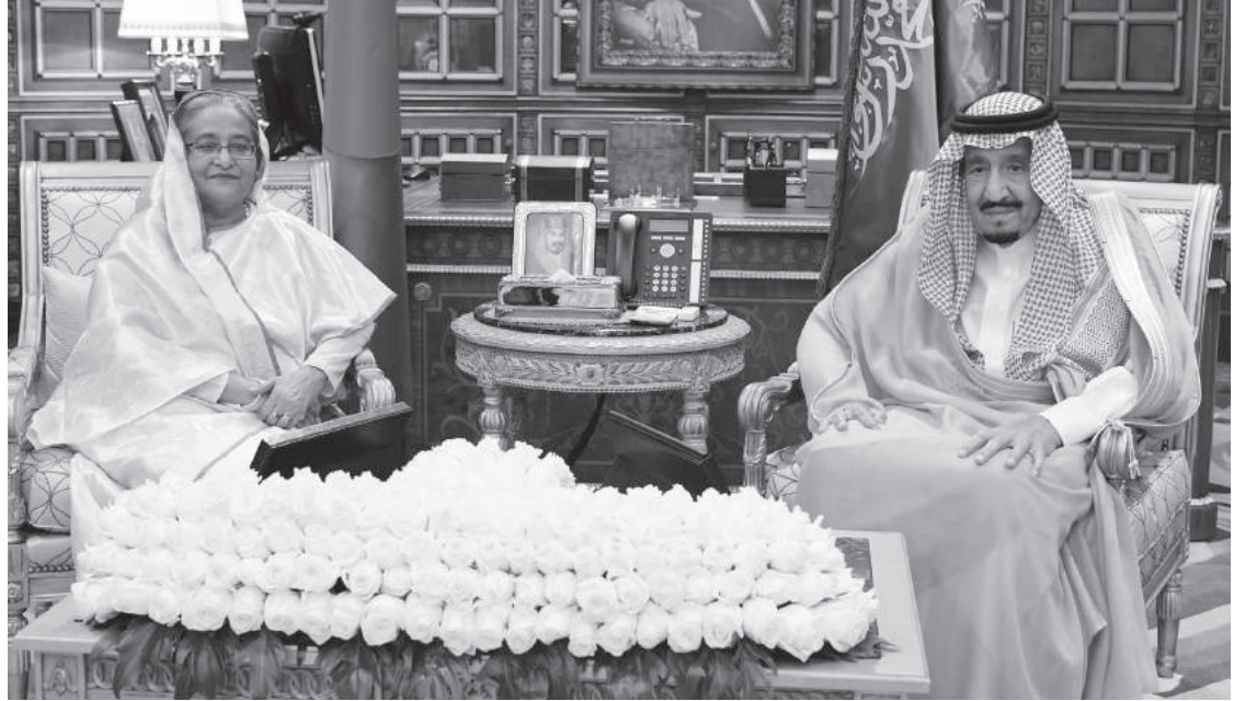
خادم الحرمين الشريفين مستقبلاً رئيسة وزراء بنغلاديش أخيراً.