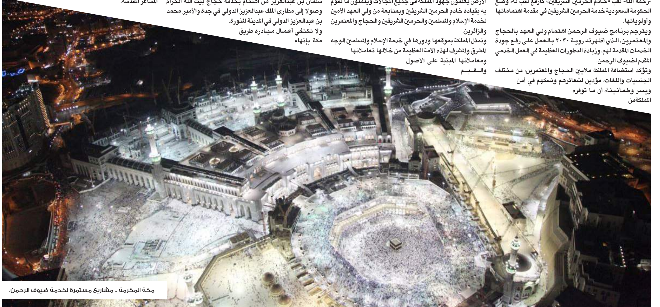
مكة المكرمة .. مشاريع مستمرة لخدمة ضيوف الرحمن.

وتؤكد استضافة المملكة ملايين الحجاج والمعتمرين، من مختلف الجنسيات واللغات، مؤدبين لشعائرهم ونسكهم في أمن ويسر وطمانينة، أن ما توفره المملكة من