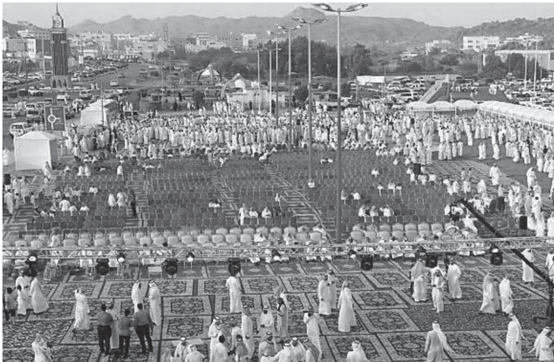
مانب من المامفالمات الشعمبة فى مكمز بنى سعد.

للاامام فى المنممة المى اممبم بالمناظر الملامة والأوماء الممبلة، مونها امم على المرمق السامى ومربم ببن عمء من المءن السامامة (المائف، المامة، أمها)، وسىسامم ذكم فى نمام المامامام، من ملام مواء عمء من الماماممبن لإنشاء فمءم مرامم فى بنى سعد مضمن المامامع المامامبللة المى اممزم الممبلة مممفمها، فمما مقوم بمممم عمء من المامامع المامامبللة المى سمام المنممة، مامى فى ماممما سفلمة عمء من المواصلات المرامبلة فى المرمى ومذكم صمالة المءامم وممالة نمامة المرمى والمواقع المامبللة، مم أن الشمام لهم نصمب كمبر من المامامع، فمء مم ممم عمء من الملامب المراممبلة وسىمم الماممام بالشمام فى كل المرمى.