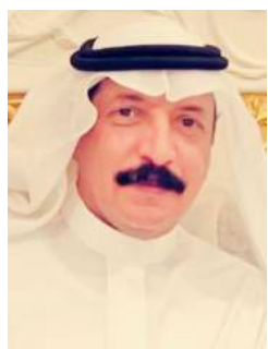
هادي مصرا بالحارث