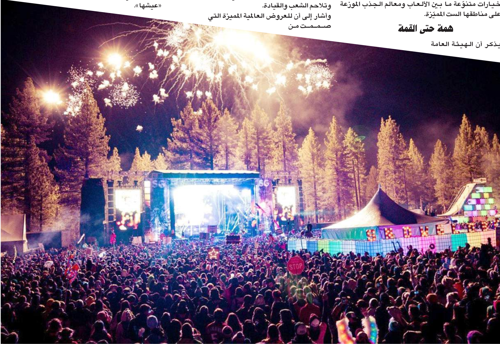
جانب من أنشطة هيئة الترفيه.

واحتوى برنامج «مواسم السعودية ٢٠١٩» على ١١ موسماً، تشمل: المنطقة الشرقية، شهر رمضان المبارك، عيد الفطر، جدة، الطائف، عيد الأضحى، اليوم الوطني، الرياض، الدرعية، العلا، حائل، شملت العديد من البرامج المصممة خصيصاً لعدد من مناطق ومدن المملكة التي تمتلك مقومات ثقافية وسياحية وتاريخية في العام الأول كمرحلة تجريبية، أصبح حديث العالم، ودلّ على أهميتها وارتكازها بالوطن العربي والعالم لما حوته المواسم من أهمية فنية وثقافية، أبرزت قوة ومكانة التطور الثقافي والفني في السعودية في شتى المجالات. وطرحت «الترفيه» أفكاراً جديدة انعكست على المتلقي