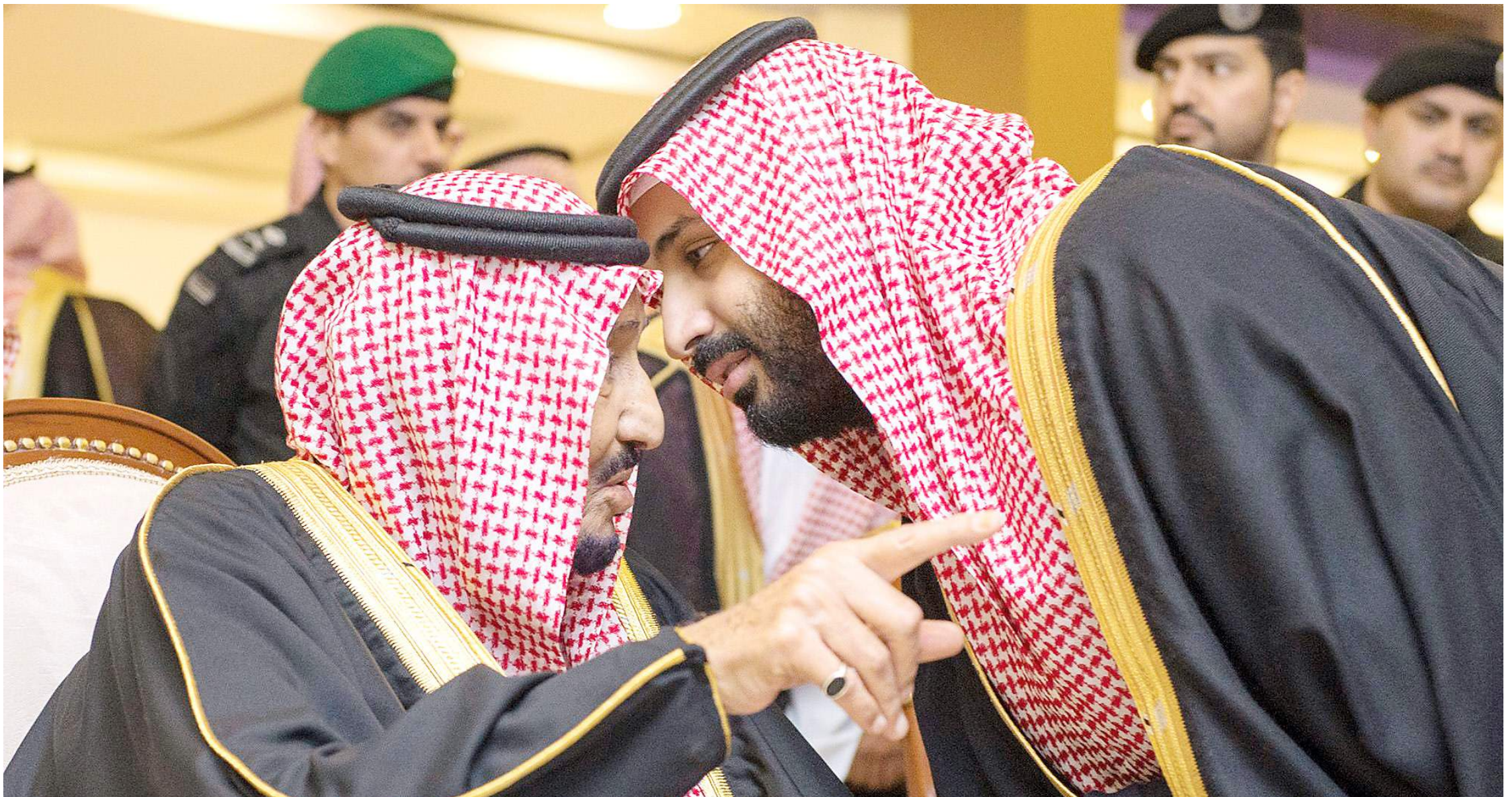
مملكة العدل والسلام أخذت على عاتقها خدمة الإسلام والمسلمين في مختلف أرجاء المعمورة.