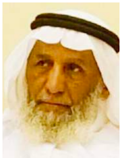
حمد حرقه بالحارث