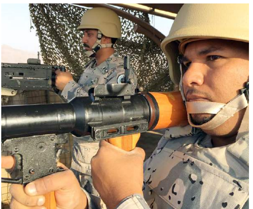
أبطالنا على الحد الجنوبي.. عيون ساهرة تذود عن الوطن.