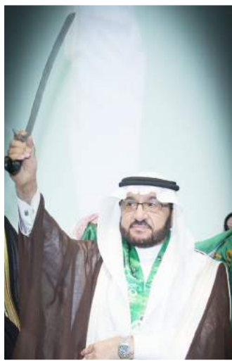
مدير جامعة طيبة في أحد الافتتاحات التي نظمها الجامعة بمناسبة اليوم الوطني.

المملكة إلى مصاف الدول المتقدمة، ستسهم أيضاً في التحول من الاعتماد على البترول إلى الاقتصاد المتنوع، وتنويع الموارد كما أننا على ثقة بأن الشعب السعودي النبيل يجدد دائماً ولاءه وبيعته لقيادته الرشيدة ويجد كل الدعم والاهتمام بقضاياهم من قبل قيادته الحكيمة. اليوم الوطني الـ ٨٩ هو مناسبة غالية على أبناء الوطن، يفرحون.. وخق لهم الفرح، يسعون.. وحق لهم ذلك.. إنه الوطن.. المكان والولاء والعتاء والانتماء.. إنه مكان الفرح والعتاء. حفظ الله وطننا وقيادتنا.. ونسأله تعالى أن يحمي ترابه وأن ينصره على كل من يحاول المساس بأمنه ووحدته وينصر جنودنا الأبطال ورجال أمننا الأوفياء الذين يذودون بأرواحهم لحماية الدين والوطن.