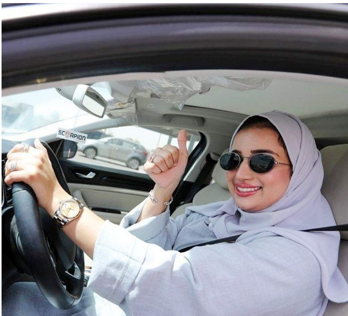
إحدى السعوديات تقود سيارتها في شوارع الرياض.