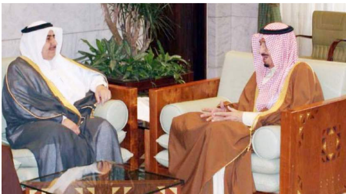
خادم الحرمين الشريفين مستقبلاً نائب رئيس مجلس إدارة الجمعية.

الشريفيين الملك سلمان بن عبدالعزيز وولي عهده، لتتويع مصادر الدخل الاقتصادي بكل تفرعاته، ومواجهة التحديات المختلفة، والاستثمار الأمثل للموارد البشرية، والعمل المتواصل لاستثمار المقومات السياسية والاقتصادية والثقافية والدينية للمملكة.