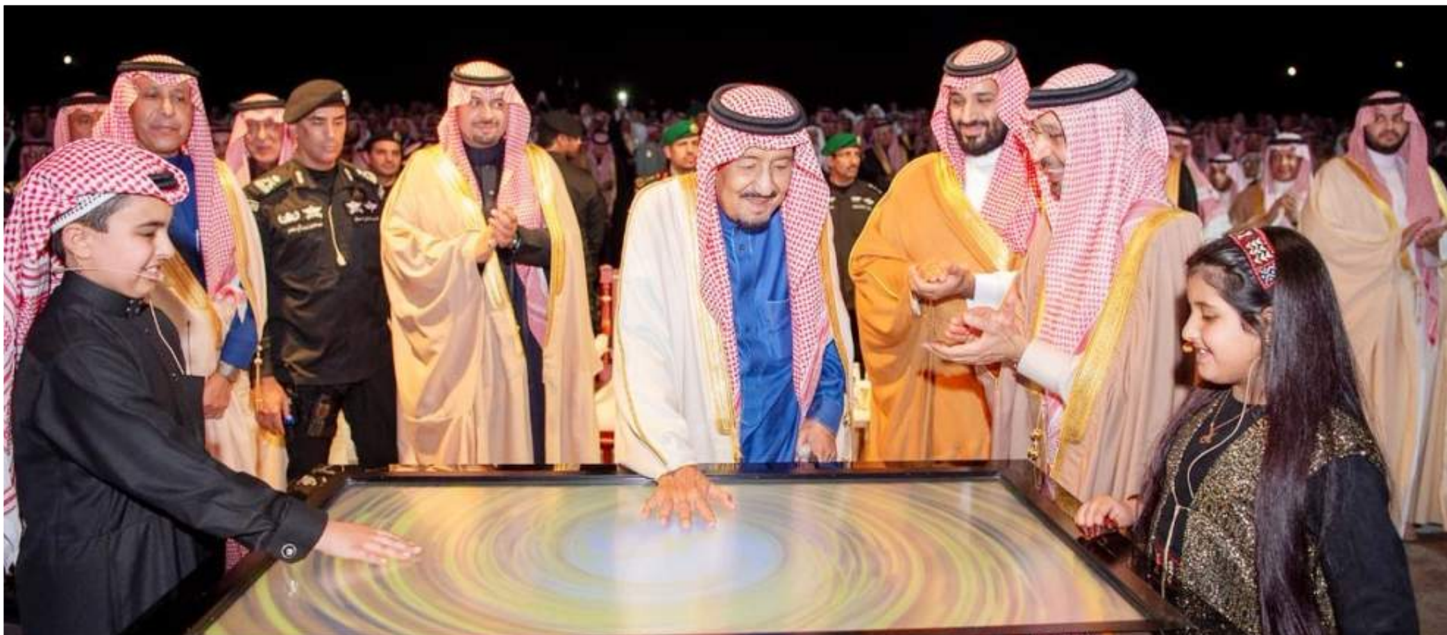
الملك سلمان بن عبدالعزيز ي دشّن منظومة مشاريع وعد الشمال.

من جهتها، ابتكرت شركة «معادن وعد الشمال للفوسفات» حلولاً عملية لتحسين كفاءة استهلاك الطاقة والمياه، والاستغلال الأمثل للموارد المتاحة، والتخلص من المواد المستنفذة عبر إعادة التدوير والمعالجة، وتأمين استدامة طويلة الأمد للأعمال، والموظفين، والمجتمع المحيط بمشاريع الشركة، فيما حرصت الشركة السعودية للخطوط الحديدية (سار) في تصميم العربات والقاطرات وأنظمة التشغيل على اتباع مواصفات عالمية لضمان الأمن والسلامة، تتميز بأنظمة عزل حراري، وتجهيزات سلامة تتمثل في صمامات أمان مانعة للاحتراق، إضافة إلى أنظمة تسخين في كل عربة، يتم من خلالها الحفاظ على درجة حرارة الكبريت عند وصوله إلى المرافق الصناعية في وعد الشمال إلى مستوى ١٤٠ درجة مئوية، لتسهيل عملية التفريغ، كما أنّ كل قاطرة مزودة بكاميرات مراقبة أمامية وخلفية HD لضمان السلامة العامة وسلامة العربات، إضافة إلى نظام إشعار متطور لمراقبة عمل العربات على الخط الحديدي أثناء النقل، يقوم بتنبيه طاقم القيادة عن أي خلل. فالمدينة فتحت أفقاً تنموية جديدة للشباب السعودي الطموح، من خلال الإيمان به وتمكينه من العمل في كل المجالات، وتحفيز القطاع الخاص وتمكينه من الإسهام بشكل فاعل وأكبر، ليتم استثمار هذه الطاقات الشابة في الإعمار والتنمية، ليحقق الوعد خلال بضع سنوات.