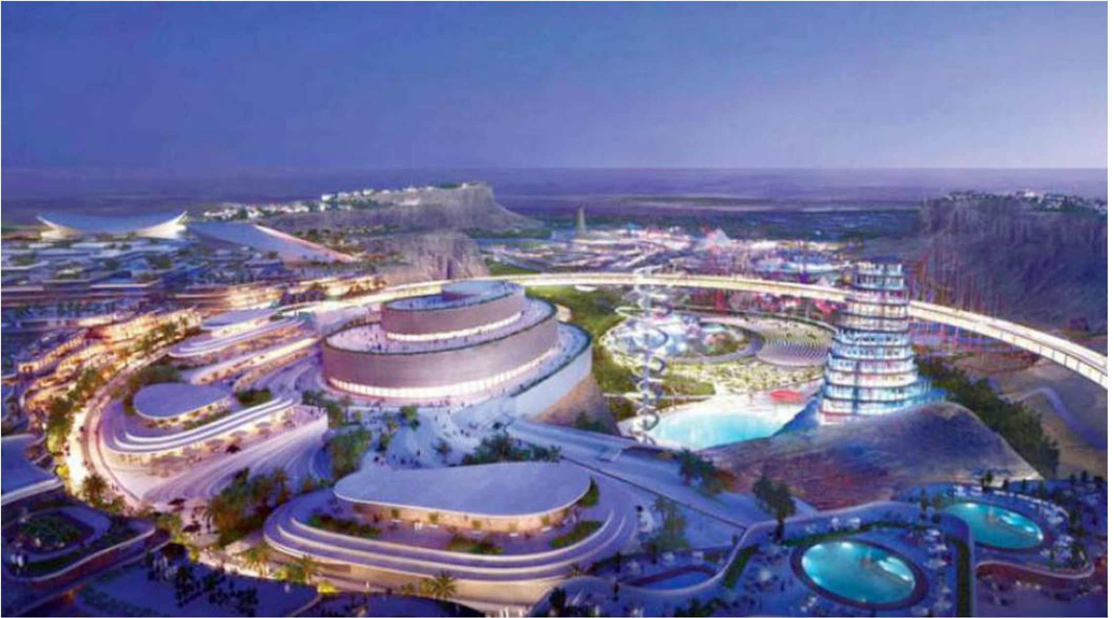
القدية.. موعد مع أكبر مدينة للترفيه.

أجل اليوم الوطني الوطني حضوراً خاصاً خلال الموسم، في صالة الهيئة العامة للرياضة بالرياض من ٢١ إلى ٢٣ سبتمبر ولمدة ساعة كاملة، كما ستقام فعالية «طريق الهمة»، وقال: «سيكون الجمهور على موعد مع عرض ترفيهي بصور الطريق الذي نسير عليه نحو المستقبل، وذلك من خلال قصة فريدة تصور فيها جميع أنحاء المملكة، وتعرض العديد من اللحظات الفنية التي تجدد الفخر والاعتزاز بماضيها وحاضرنا وتطلعنا لمستقبلنا الزاهر والواعد».