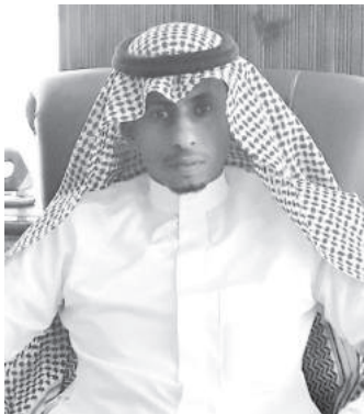
م، على صمءم

وممامم وقوء وممامعم للوممام السرمبلة وممرها من المامامع المى مموافق مع رؤمبة ٢٠٣٠، مامم إن هنام مومها كمبرا لاسمقام رجال الأعمال والماماممبن والمعموم مامم