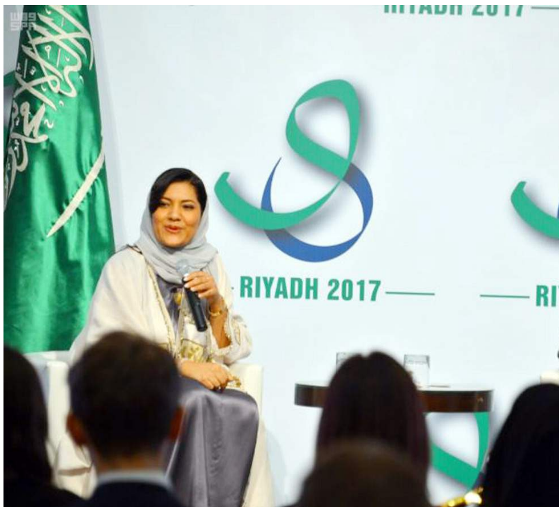
الأميرة ربما بنت بندر بن سلطان تتحدث في إحدى المناسبات عن مكانة المرأة السعودية.

وأتبنت المرأة السعودية تمكناها وإبداعها في