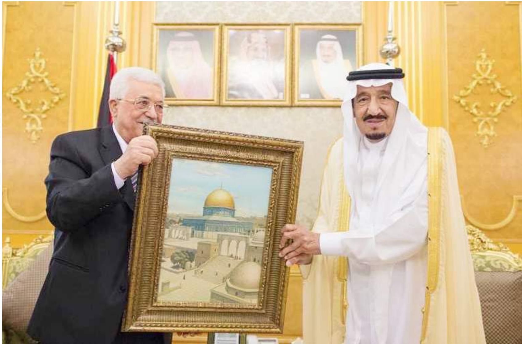
خادم الحرمين الشريفين الملك سلمان بن عبدالعزيز أكد أنه لا حل بدون دولة فلسطينية عاصمتها القدس.

وبشهادة الفلسطينيين أنفسهم، الذين قلدوا الملك سلمان، حين توليه إمارة الرياض، وسام نجمة القدس تقديراً لما قام به من أعمال استثنائية تدل على التضحية والشجاعة في خدمة الشعب الفلسطيني، إبان رئاسته المبادرة الشعبية السعودية لإغاثة الفلسطينيين، وشهادة الرئيس الفلسطيني محمود عباس في قمة التضامن الإسلامي في إسطنبول التي قال فيها: «إن السعودية واقفة معنا منذ البداية إلى جانب شعبنا منذ البداية، وهذا ما أكده خادم الحرمين الشريفين الملك سلمان بن عبدالعزيز وولي عهده خلال زيارتي الأخيرة، قال لي الملك كلمة واحدة لا حل بدون دولة فلسطينية عاصمتها القدس»، الأمر الذي يؤكد أن الدم الفلسطيني، دم سعودي، لم تتغير بصمة موقفه الثابتة مع قضيته الأولى وإن طال الدهر.