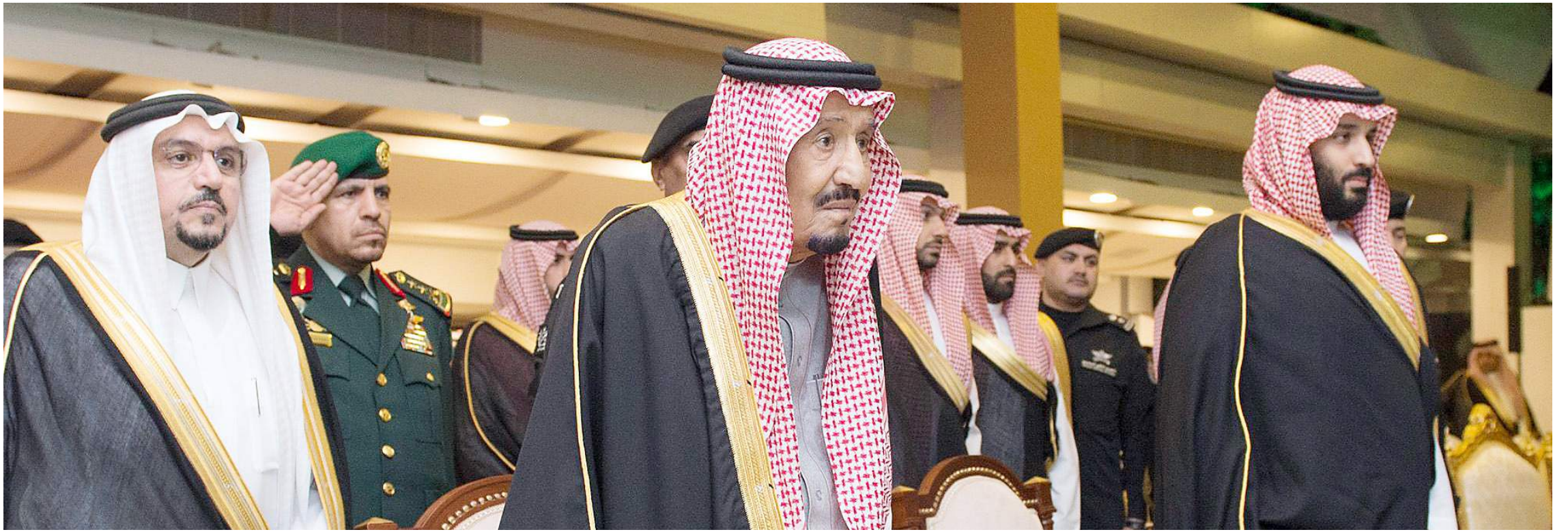
السعودية تشهد في عهد الملك سلمان بن عبدالعزيز والأمير محمد بن سلمان تحقيق الإنجازات سياسياً واقتصادياً وتنموياً لتجسد مسيرة البناء والرخاء.

العام الموافق ٢٣ سبتمبر ١٩٣٢م يوماً لإعلان قيام المملكة العربية السعودية».