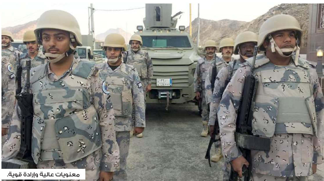
معلومات عالية وإرادة قوية.