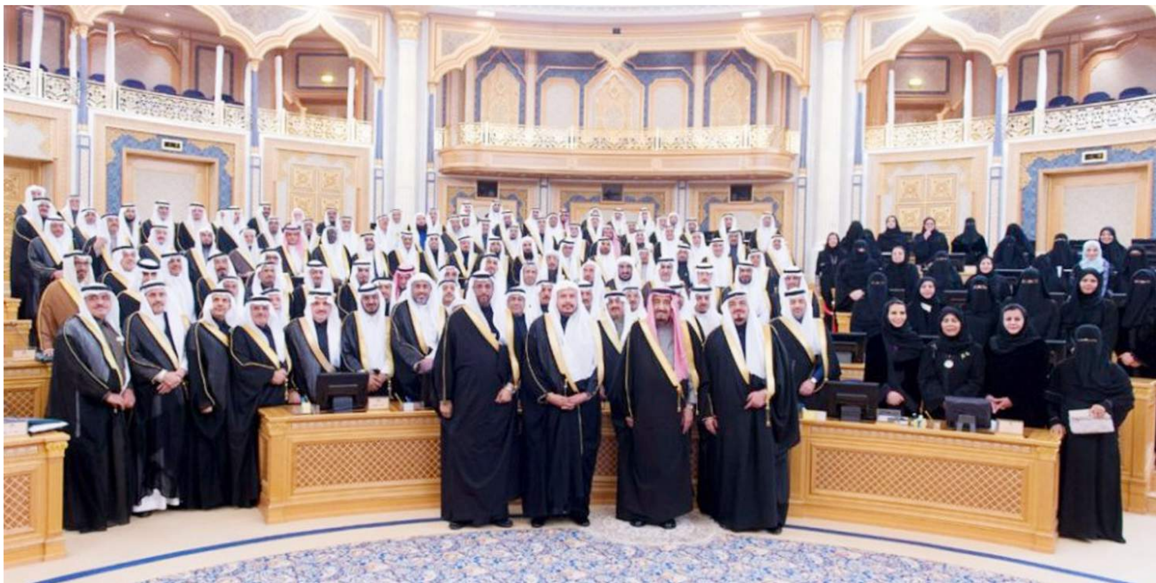
المرأة السعودية حاضرة بقوة في مجلس الشورى.

ضبط زواج القاصرات وقصر الإذن بتزويج من هي في سن ١٧ فما دون على المحكمة المختصة، وأن يكون طلب التزويج مقدما من الفتاة أو وليها الشرعي في النكاح، أو والدتها.